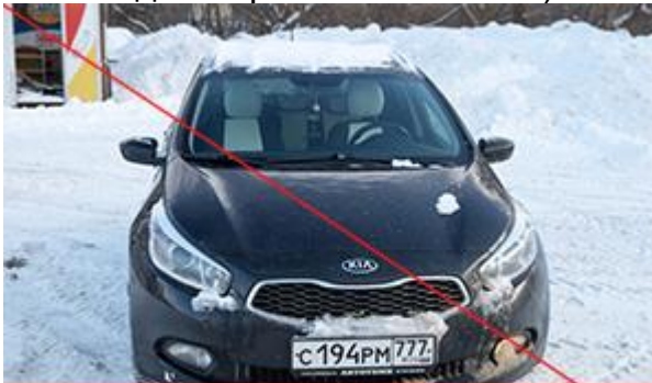
Не видно бортов