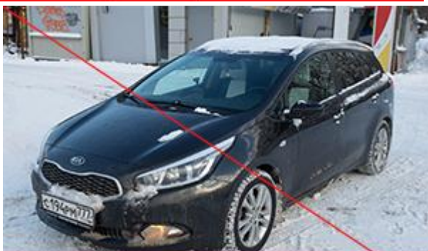
Неправильный ракурс (не тот борт)