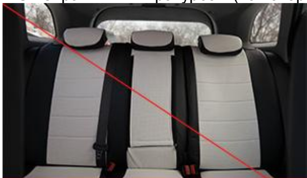
Не видно элементов интерьера