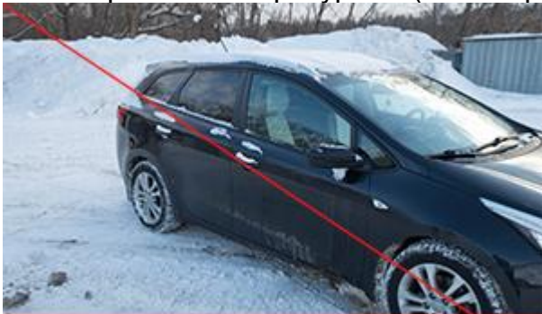
Не видно номера и носовой части