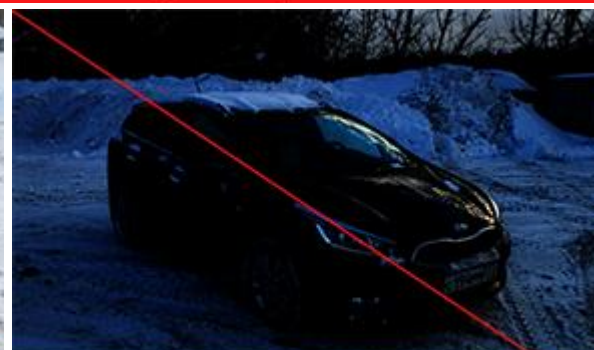
Слишком темная фотография