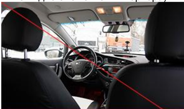
Не видно состояний сидений